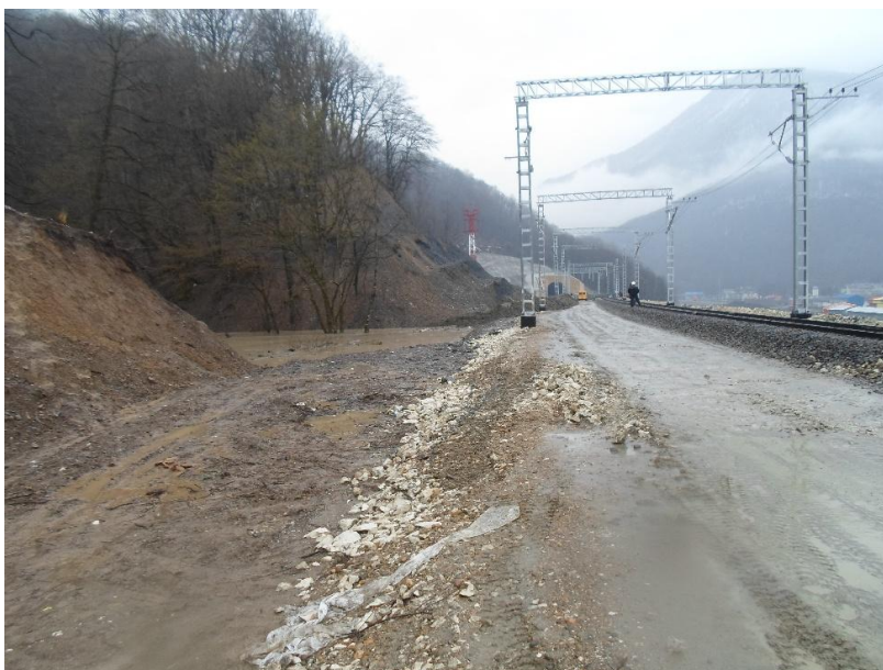
Рисунок 6,7 – Сход техногенного селевого потока на участке пк458+30,5.

Последствия схода селевых потоков были устранены в сжатые сроки силами ООО УК «Трансюжстрой» и в октябре 2013 г. дорога была введена в эксплуатацию (рисунок 8).