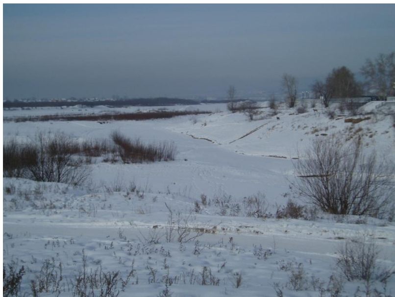
Рисунок 9,10 – поймы рек Селенга и Уда.

Еще одним перспективным направлением нашего сотрудничества является возможность применения объемных геоячеек на ж.-д. транспорте с целью обеспечения устойчивости и стабильности рельсовой колеи в конструкции железнодорожного пути. Это позволит обеспечить бездеформативность и равноупругость подрельсового основания на всём его протяжении. Необходимо отметить, что вследствие вибродинамического воздействия от подвижного состава на основной площадке с недостаточной несущей способностью грунтов происходят дефекты и деформации. Существует проблема обеспечения стабильности основной площадки земляного полотна на линиях, где предусматривается введение скоростного пассажирского движения и повышение осевых или погонных нагрузок для грузового движения. Эффективным способом решения этой задачи является устройство подбалластных защитных слоев путем их армирования объемными геоячейками «ПРУДОН-494» (патент на полезную модель №108044) /рисунок 11/.