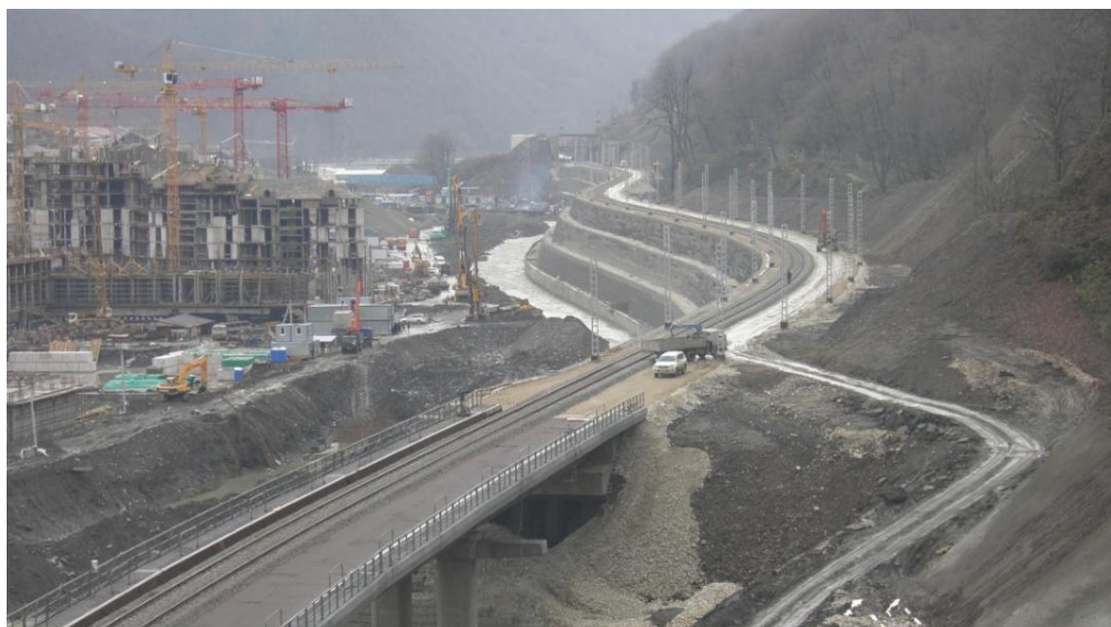
Рисунок 5 – 15 этап. Армогрунтовая насыпь на участке пк 457+00 – пк 467+71.