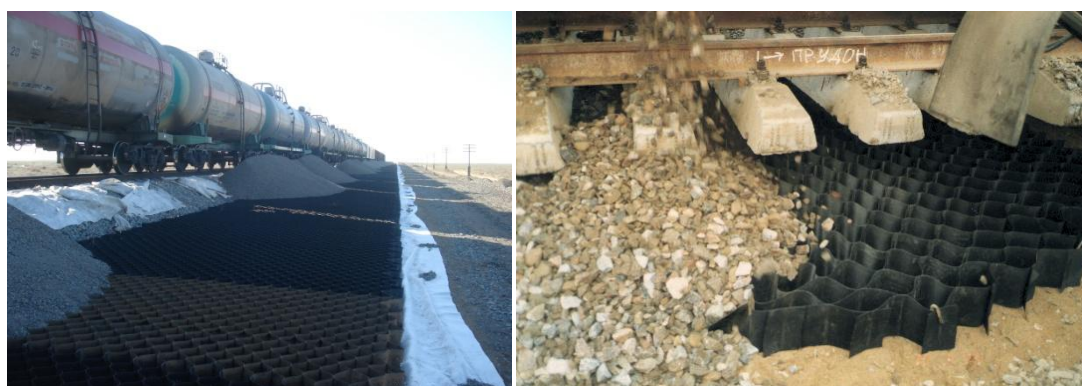
Рисунок 12 – Применения геоячеек «ПРУДОН-494» с целью усиления основной площадки земляного полотна (в том числе при проектировании вторых путей)

При сооружении земляного полотна на слабых основаниях или болотах требуется выполнение мероприятий по его стабилизации. Одним из решений по стабилизации основания земляного полотна является его армирование объемными геоячейками «ПРУДОН-494». Армирование используется в основаниях для того, чтобы увеличить стабильность насыпей, избежать отказа из-за чрезмерной деформации или сдвига в основании (рисунок 12).