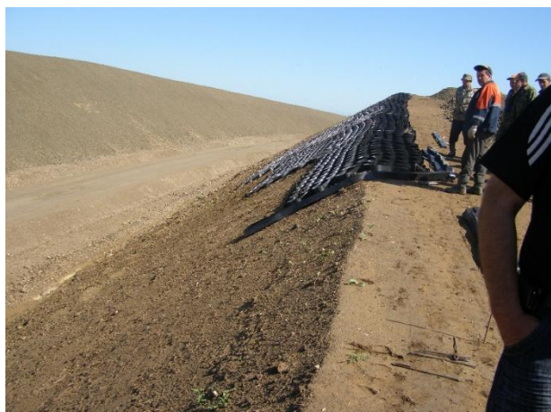
Рисунок 1,2 – Применение объемных пластиковых геоячеек «ПРУДОН-494» для укрепления откосов выемки.

На участке ответственности ОАО «Сибгипротранс» (ст. Борзя - ст. Александровский завод)) объем укладки пластиковых геоячеек составил – 85,88 тыс. м 2 .