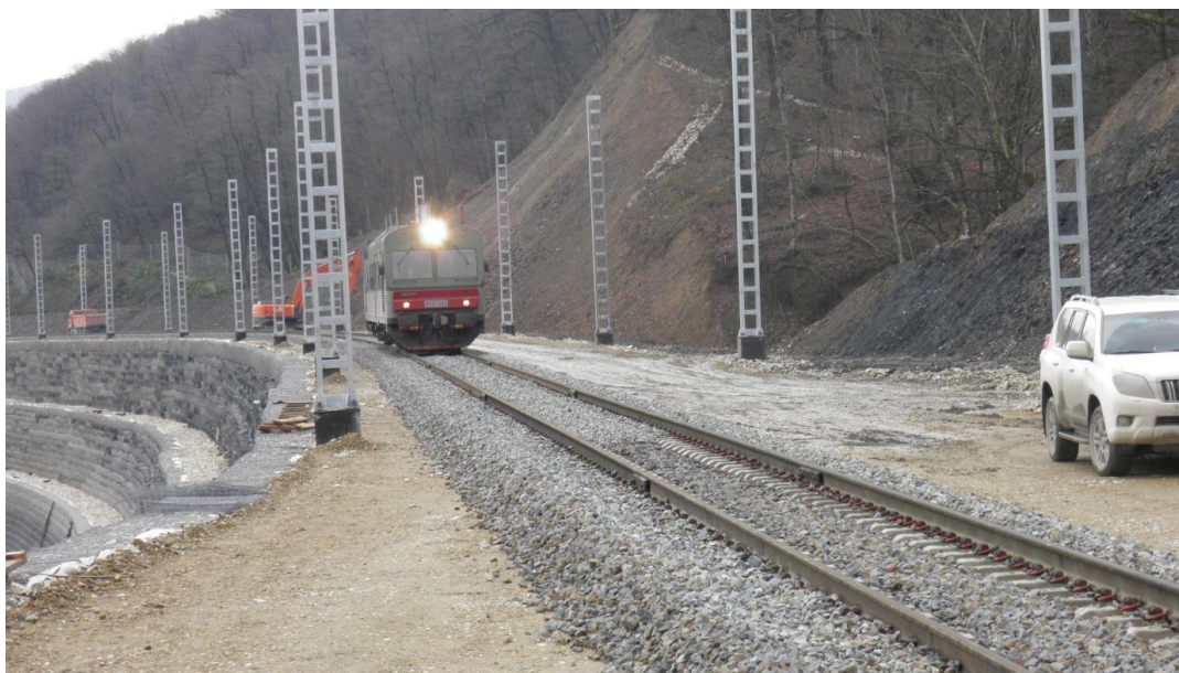
Рисунок 8 – Рабочее движение на участке 15 этапа.

Перспективы дальнейшего сотрудничества. Между нашими двумя организациями есть прекрасная возможность продолжить наше совместное сотрудничество в работе по объекту: «Защита г. Улан-Удэ от затопления паводковыми водами рек Селенга и Уда Республики Бурятия». Основанием проектирования является федеральная программа «Охрана озера Байкал и социально-экономическое развитие Байкальской природной территории на 2012 – 2020 годы», Государственная программа республики Бурятия «Охрана окружающей среды и рациональное использование природных ресурсов». Заказчиком является Министерство природных ресурсов Республики Бурятия. Объем проектирования – 22 км берегоукрепительных сооружений, защитные сооружения протяженностью порядка 82 км (рисунок 9, 10). По верху защитных сооружений предусмотреть эксплуатационные проезды шириной не менее 4 м.