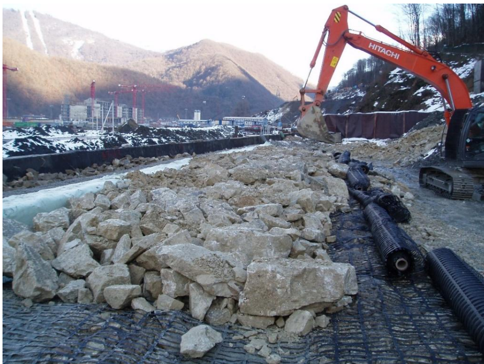
Рисунок 4 – Выполнение строительных работ на участке армогрунтовой насыпи.

Каменского карьера (рисунок 4). На глубину в 1 м от верха основной площадки земляного полотна, в связи с размещением в теле насыпи кабельных лотков, насыпь не армировалась. В качестве укрепления откоса насыпи принята габионная система (размеры модулей: 3х2х1 м и 3х2х0,5 м) /рисунок 5/. На участке пк 457+00 – пк 466+76 слева, со стороны реки Мзымта, устраивается низовая подпорная железобетонная стена.